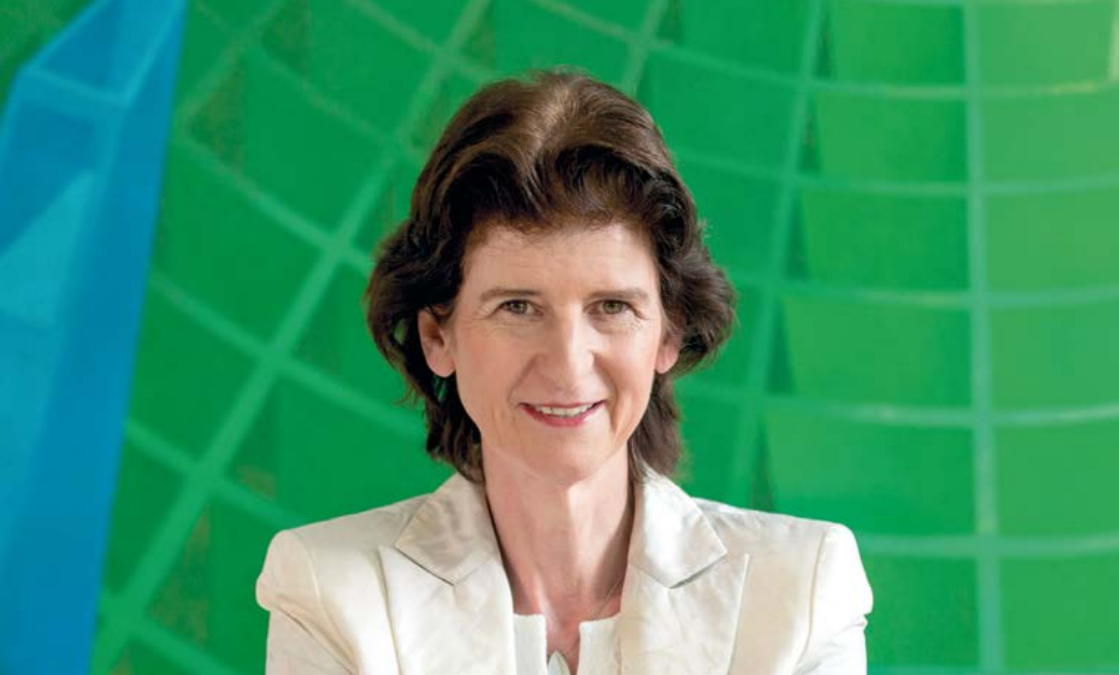
Staatsministerin Dr. Eva-Maria Stange

Bildungsangebote auch außerhalb der urbanen Zentren zu stärken, die Kulturelle Bildung in der Schule deutlicher zu akzentuieren, die kulturelle und interkulturelle Kompetenz zu fördern, werden wir damit ein ganzes Stück näher kommen.